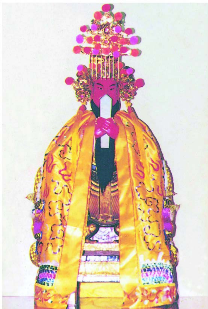
玉皇天尊玄靈高上帝